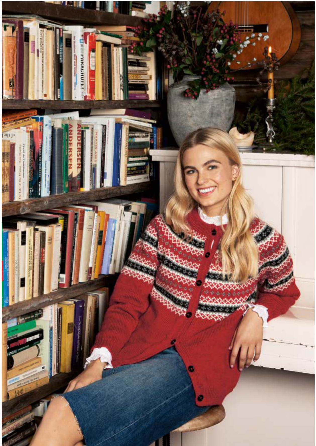
277-1 Rundfelt julejakke i Mitu