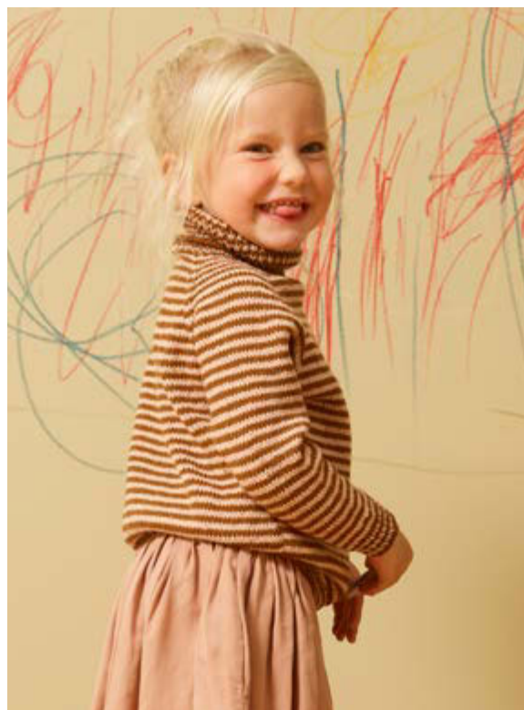
Designer: Rauma Garn / Marie Cecilie Dahl www.raumagarn.no