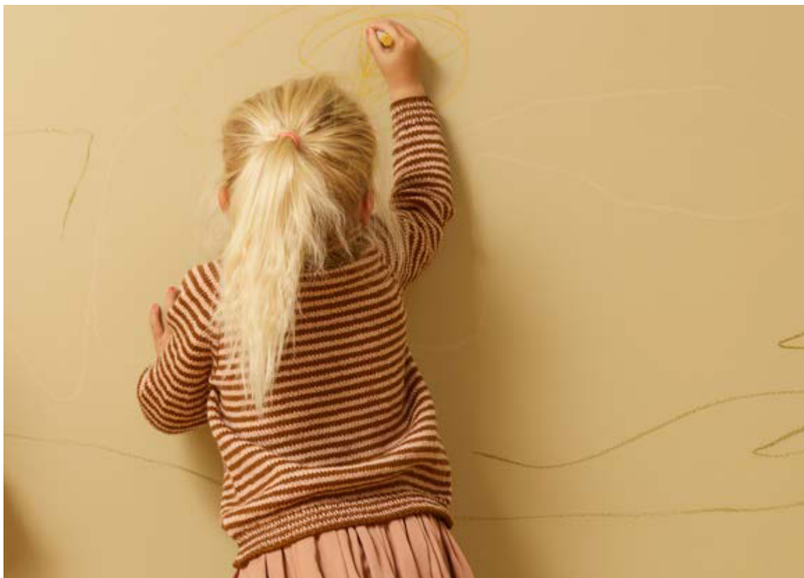
396—3 Charlie høyhalser i babygarn