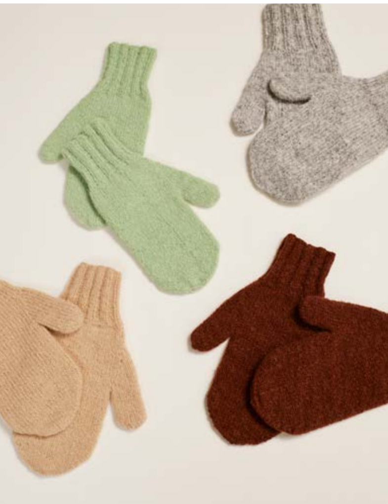
Design: Rauma Garn /Stina Fredriksson raumagarn.no