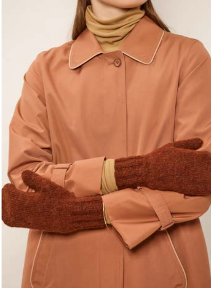
409 Viola votter