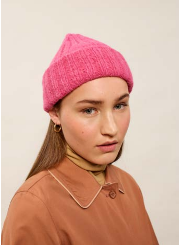
409-3 Viola ribbelue