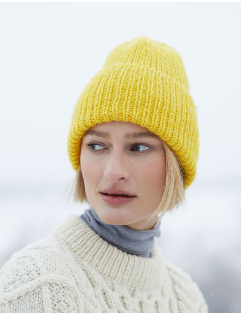
425-4 Billie ribbelue og votter

Design: Rauma Garn / Stina Fredriksson. raumagarn.no