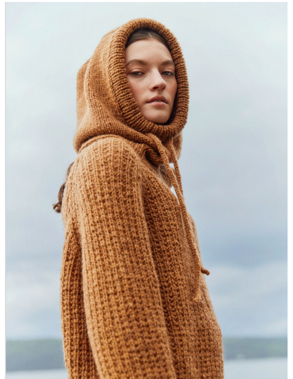
Design: Rauma Garn / Stina Fredriksson. raumagarn.no