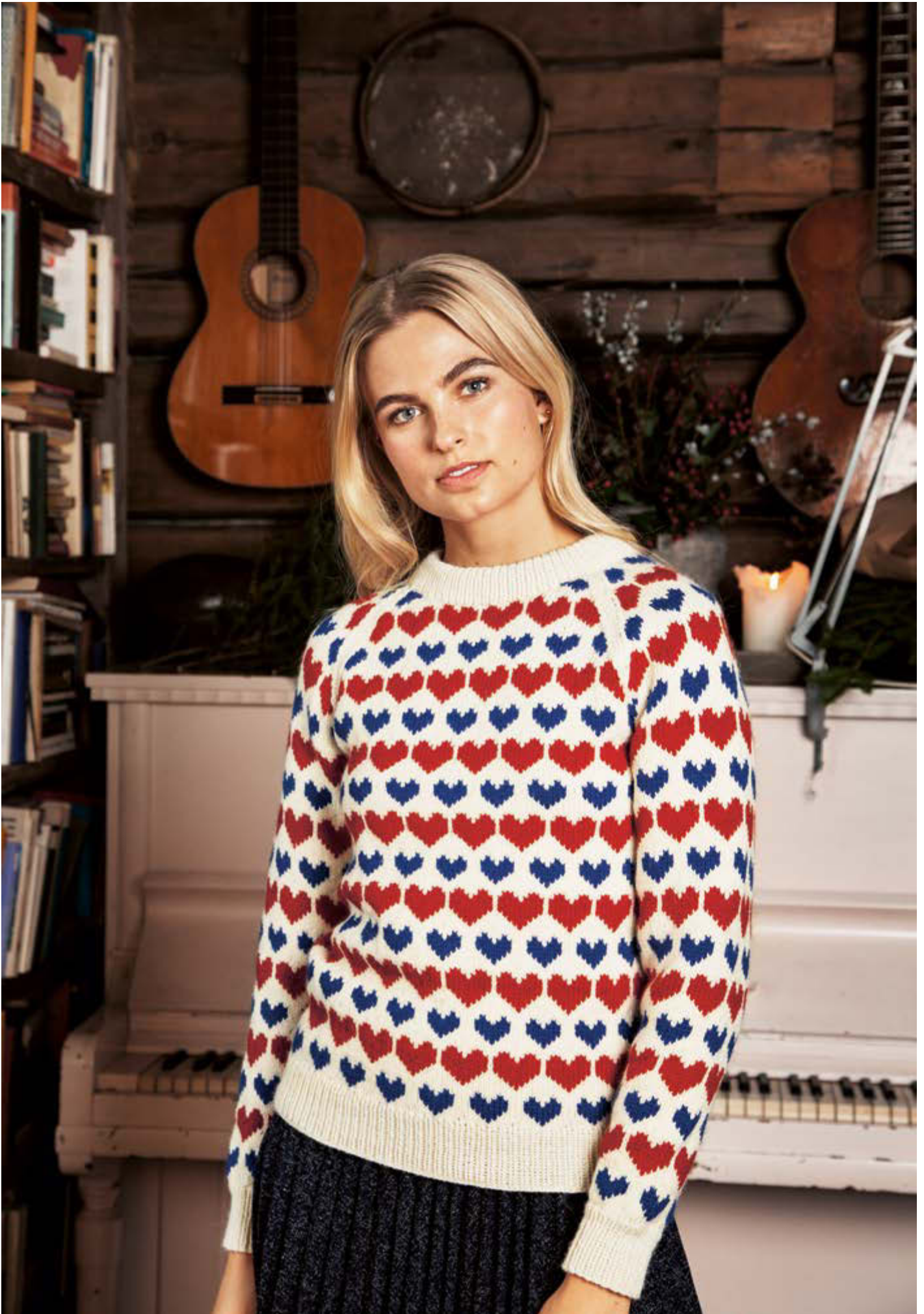
277-7 Hjertegenser i Mitu