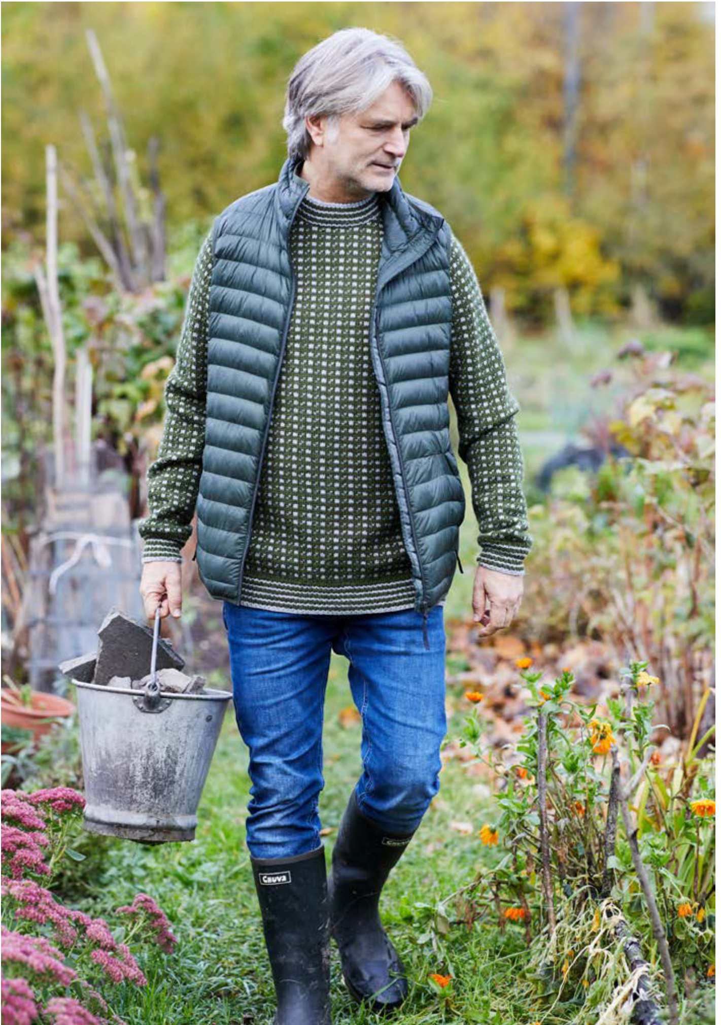
365-3 Islander til herre